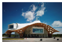
ポンビドゥーセンター・メス